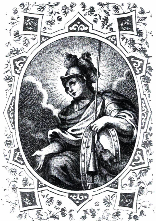
St. Georgius. St. George.