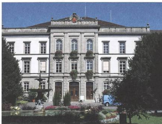
Abb. 1: Das heutige Hauptgebäude der Psychiatrischen Klinik Königsfelden, erbaut 1868–1872.

Mit der Gründung des Aargaus 1803 übernahm der Staat auch die Aufsicht über das Gesundheitswesen. Der Kanton unterhielt damals ein eigenes Spital, und zwar seit 1804 in den - später grösstenteils abgebrochenen - Räumlichkeiten des ehemaligen Klosters Königsfelden. 1530 war in diesem aufgehobenen Kloster durch den Staat Bern eine Kranken- und Pflegeanstalt eingerichtet worden, die 1803 mit ungefähr 40 Betten an den Aargau übergang. Diese Anstalt, im Zentrum des Kantons und in einer Gegend mit günstigen Klima- und Wasserverhältnissen gelegen, war andererseits in einem so schlechten Zustand, dass im 19. Jahrhundert immer wieder nach einer Erneuerung gerufen wurde. Die Anstalt, in der zeitweilig auch Sträflinge untergebracht waren, umfasste neben einer Gebäranstalt eine Abteilung für körperlich Kranke und eine für geistig und seelisch Kranke, oder anders gesagt, eine für Kranke (Krankenanstalt) und eine für Irre (Irrenanstalt). In Wirklichkeit war es ein wunderliches Gemisch aus Spital, Armenhaus, Pflegeanstalt und Chronischkrankenheim.