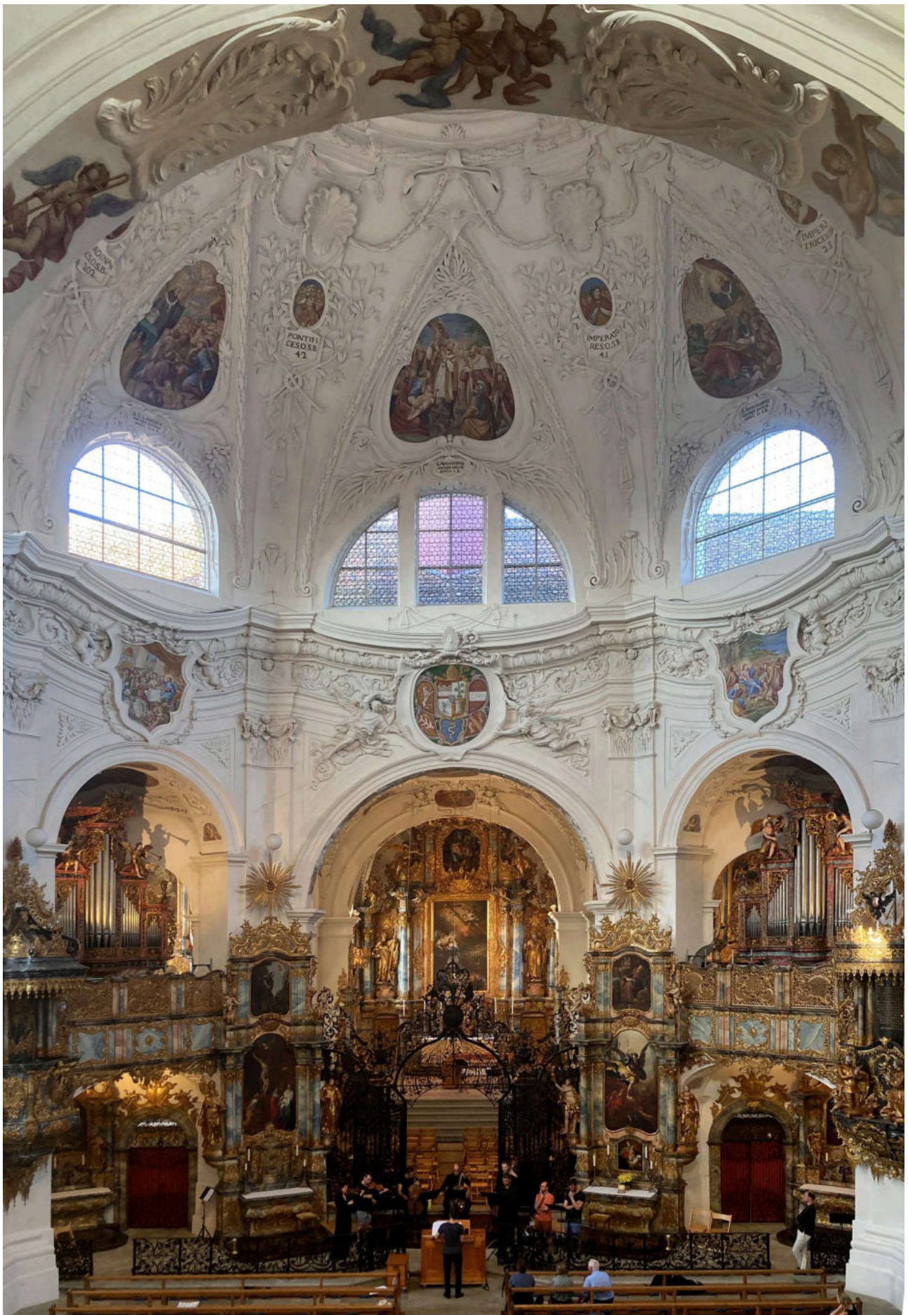
Hoch und hell: Die Kuppel, von Baumeister Giovanni Battista Bettini erstellt und stuckiert.