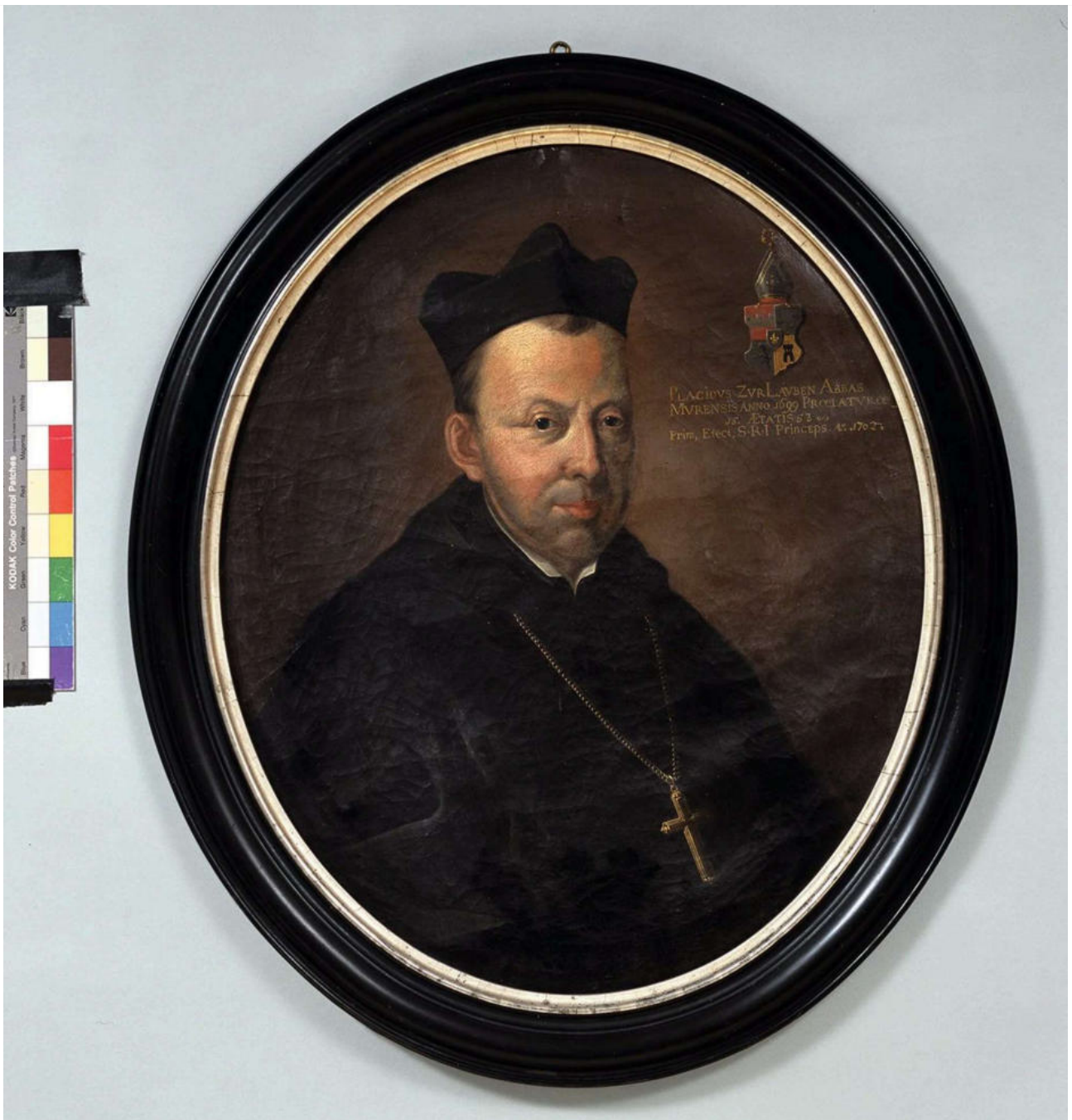
Abt Plazidus Zurlauben 1702 auf einem Bild im Benediktinerkollegium Sarnen.