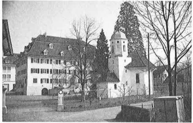
Schloß und Schloßkapelle Gachnang heute.

1767. Der einsiedlerische Gutshof Gachnang floriert. Das auffällige und zu klein gewordene alte Schloß weicht dem heutigen klassischen spätbarocken Neubau. Das Stift läßt die ganze Herrschaft vermessen, erstellt von Gachnang bereits 1721 eines der ersten kartographischen Werke und macht eine Bestandesaufnahme der herrschaftlichen Güter und kirchlichen Gegenstände. Seit 1798 ist der Kanton Thurgau freier, gleichberechtigter Kanton der Eidgenossenschaft. Doch