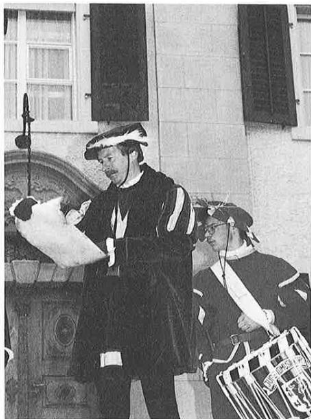
Herolde rufen das Jubiläumsjahr aus.

te. Alfred Huggenberger, unser «Dichter der Heimat», wohnte in jungen Jahren im zürcherischen 2 km entfernten Bewangen und besuchte die Volksschule in Gachnang. Er soll als Junge, nach seinen eigenen Worten, nicht recht gewußt haben, ob er eigentlich «Zürpieter» oder Thurgauer sei. 1921 hat die Viehseuche den ganzen Bestand weggerafft.