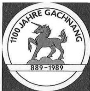
Ortsgemeindewappen mit Jubiläums- Inschrift

Neujahrstag 1989. Bürgermeister, Dorfweibel und Leutpriester, angeführt von Herold und Tambour, verkünden wie einst auf dem Schloßplatz feierlich den Beginn des Jubeljahres. Nach dem Grenzumgang dürfen sie als Gäste des Stadtrates Frauenfeld – sozusagen in «Vertretung» des früheren Landvogtes und als historische Erinnerung – die «Befreiungs-Urkunde von der Huldigungspflicht» entgegennehmen.