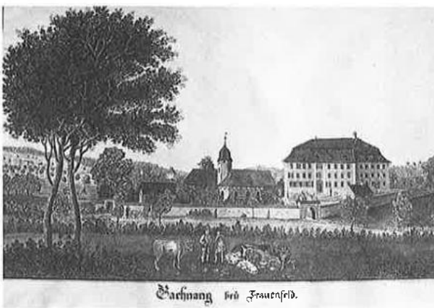
Vedute des Schlosses Gachnang. Künstler unbekannt, zirka 2. Hälfte 18. Jahrhundert. Original im Kloster Einsiedeln; Reproduktion mit dessen Gen.

Wir schreiben ungefähr die Jahre um 1200 herum. Auf dem Gutshof, wo nun auch Ackerbau und Weinbau betrieben wird, finden viele Leute ihr Brot, oft sind es Leibeigene, oft Lehensbauern. Auch die umliegenden Weiler und Gehöfte wachsen, vermehren sich. Werdende Städte und Klöster mit vielen Insassen und langsames Ansteigen der Bevölkerung führen zu Handel mit Landesprodukten. Der Bauer ist nicht mehr nur Selbstversorger, der Thurgau entwickelt sich zur geschätzten Kornkammer, sein durch fleißige Bauernhände «produktiv» gewordenes Land wird begehrt, sei es vom Adel oder Kirchenfürsten. Neue Herrensitze entstehen und benötigen auch ihr Gesinde. So wächst die Zahl der Gläubigen oder Kirchgänger. Eine stolze, massive Basilika in romanischem Baustil muß anfangs des 13. Jahrhunderts anstelle der umgekommenen Holzkirche entstanden sein. Die Fundamente, ein Teil der Mauern des heutigen Kirchenschiffes und der romanische Rundbogen der westlichen Eingangspforte zeugen noch davon. Die Steine dieser Mauern wüßten viel zu berichten!