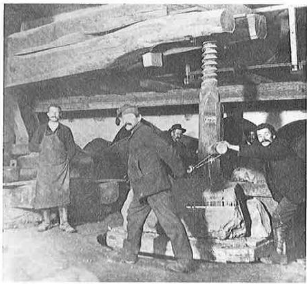
Trotte in Gachnang im Betrieb. Anfangs 20. Jahrhundert.