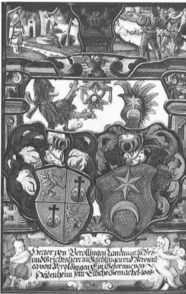
Allianzscheibe Beroldingen/Heidenheim, 1608, Wolfgang Brenz, Glasmalerei, Original Privatbesitz.

1639 sieht sich der neue Gutsherr veranlaßt, der umgreifenden Sittenverrohung zu begegnen und ein klares Sittenmandat zu erlassen. «Spinnstuben, Freß- und Sauffereyen sowie Hurerey» werden bei schwerer Strafe verboten.