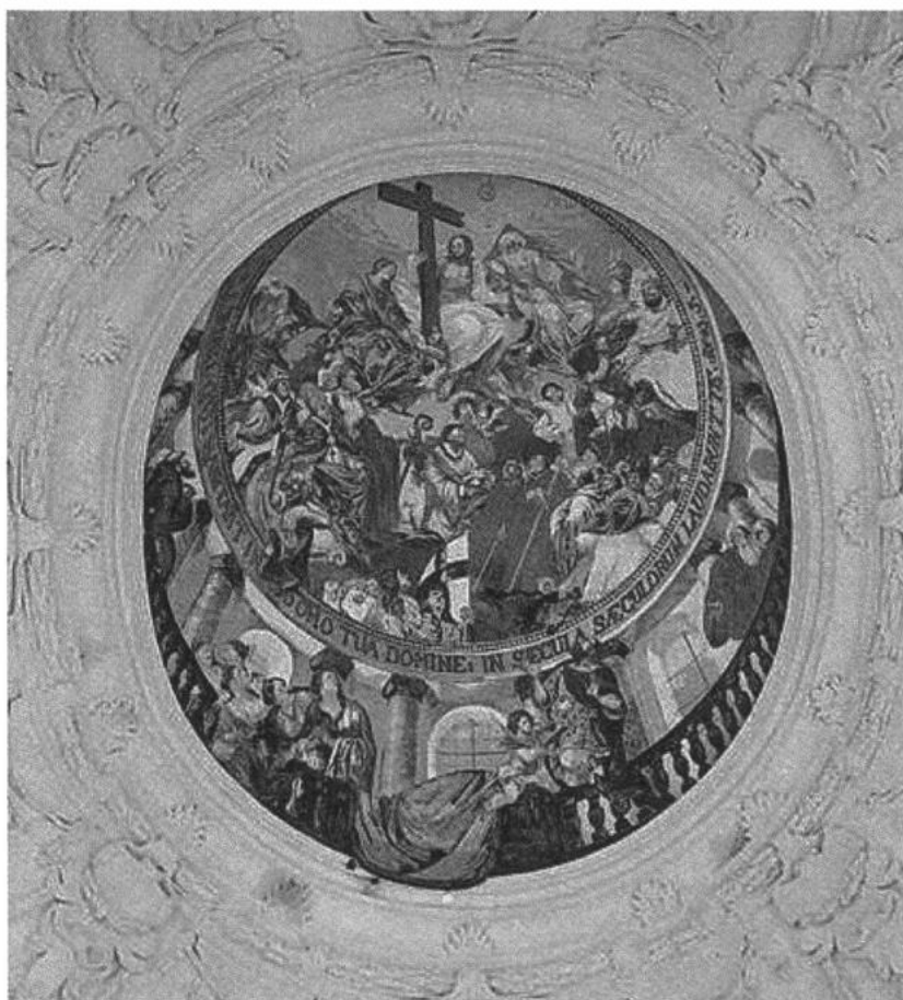
Abbildung 2: Kuppelbild Klosterkirche Muri, Leodegar Kretz, Übermalung 1830/33. Staatsarchiv Basel-Stadt.

der Oktogonfreske wieder. Die Platte stammt aus dem Staatsarchiv des Kantons Basel-Stadt und gehörte von Anfang an zu dessen Inventar. Sie dürfte ein Dutzend Jahre vor der Eröffnung der Sammlung 1903 hergestellt worden sein, ungefähr im gleichen Zeitraum wie der Besuch von Markwart stattfand. – Später hat die aargauische Denkmalpflege alle Bilder vor und nach der Renovierung auf Fotofilm dokumentiert. Eine solche Dokumentation fehlt einzig für die Übermalung des Engelsturzes über Orgel und Beichtkirche. Laut Germann 5 habe sie die heilige Cäcilia im Stil von Raffael dargestellt.